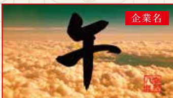
雲海に午の文字と印