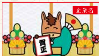
扇子を賀正と持って登場!